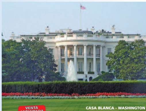
CASA BLANCA - WASHINGTON

VENTA ANTICIPADA D Descuento 5% | 8% PLAZAS LIMITADAS