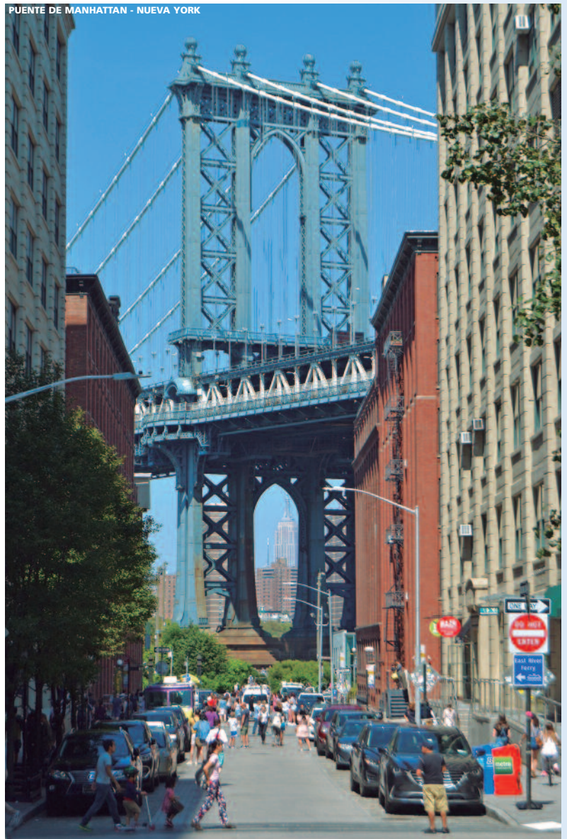
PUENTE DE MANHATTAN - NUEVA YORK