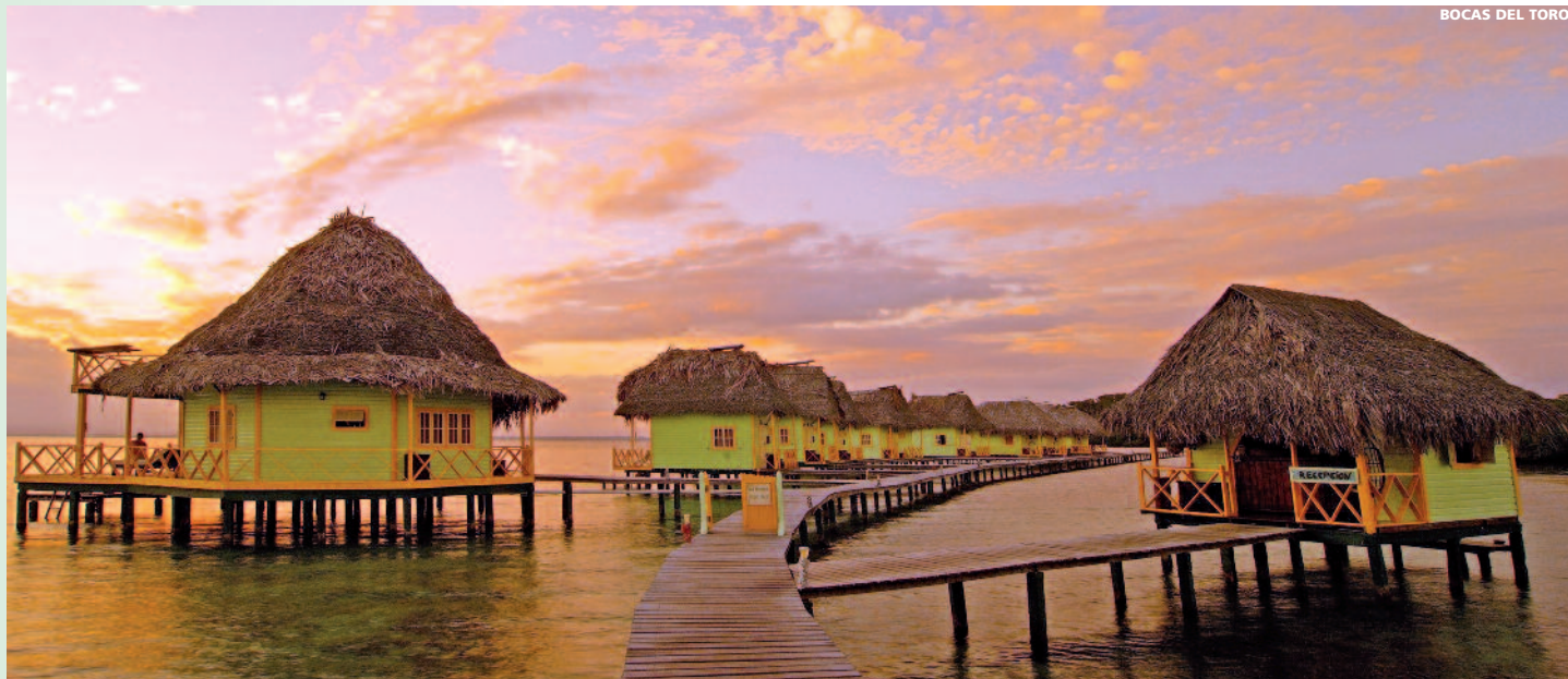
BOCAS DEL TORO

• Desayuno. Por la mañana salida para explorar el Archipiélago de Bocas del Toro. Salida hacia Bahía Delfines, Cayo Coral y Red Frog. Durante el recorrido se quedará sorprendido por la claridad del agua y la belleza del entorno panameño. Visita de la bahía de los Delfines , que debe su nombre a la gran cantidad de delfines que rodearán su bote. Continuación hasta Cayo Coral , un precioso lugar donde abundan los corales y peces multicolores. Para terminar, seguirá hasta la playa de las Ranas Rojas , que recibe su nombre por la pequeña rana de