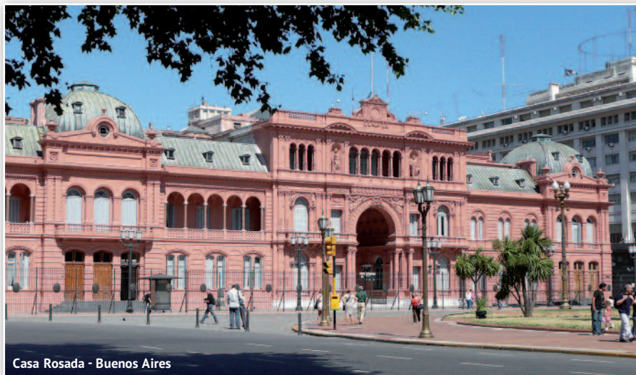
Casa Rosada - Buenos Aires