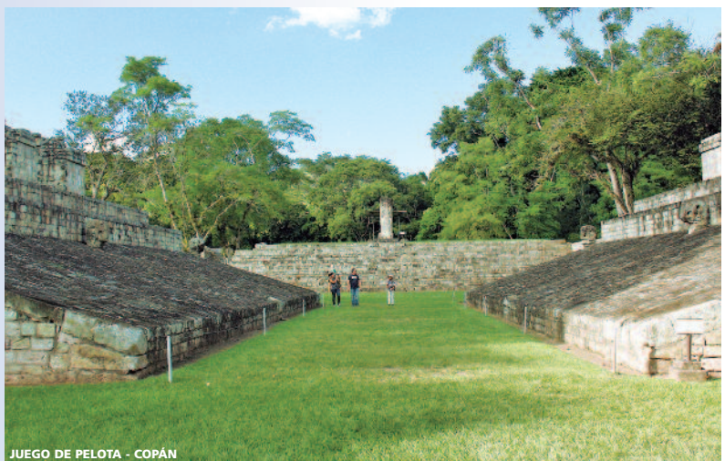
JUEGO DE PELOTA - COPÁN

Notas: - Consulte precio definitivo de las tasas al efectuar la reserva (ver notas importantes sobre transporte y tasas de aeropuerto en página 39). - Consultar precios y suplementos a partir del 10 de Diciembre de 2017 y para Semana Santa y Navidad. - Para las extensiones a Nicaragua y Costa Rica, se aplica un supl. aéreo mínimo en clase "N".