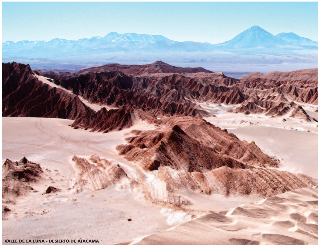
VALLE DE LA LUNA - DESIERTO DE ATACAMA

Incluyendo 10 DESAYUNOS, 3 ALMUERZOS y 18 VISITAS