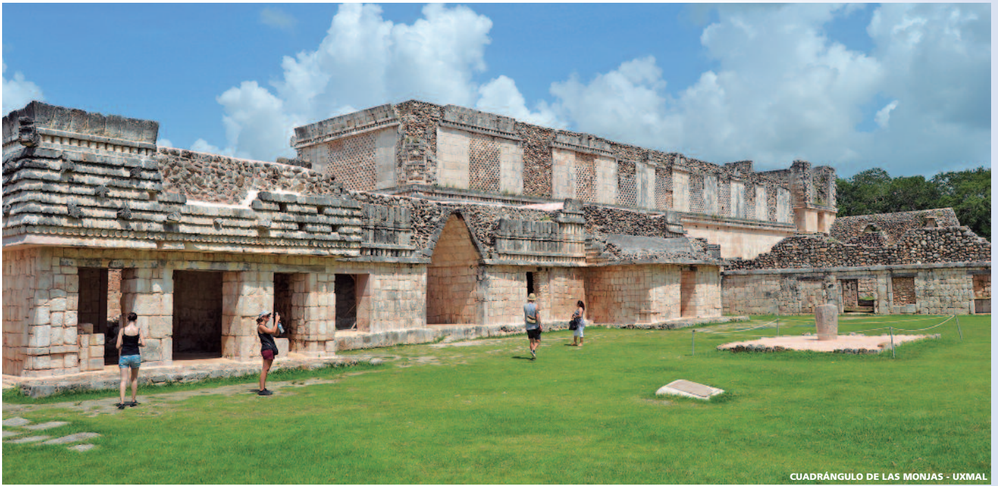
CUADRÁNGULO DE LAS MONJAS - UXMAL