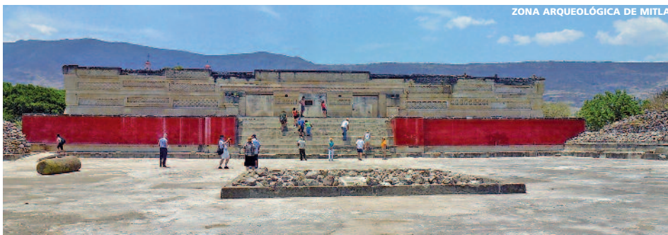
ZONA ARQUEOLÓGICA DE MITLA

Nota: Es de obligación en los hoteles de Riviera Maya el pago de una tasa medioambiental. El coste de la tasa es de 20 $ MXN (1,15 USD) por habitación y noche. La tasa se abonará directamente en el hotel en el momento de la llegada y podrá efectuarse con tarjeta de crédito/débito o en efectivo (en cualquier moneda principal, excepto USD).