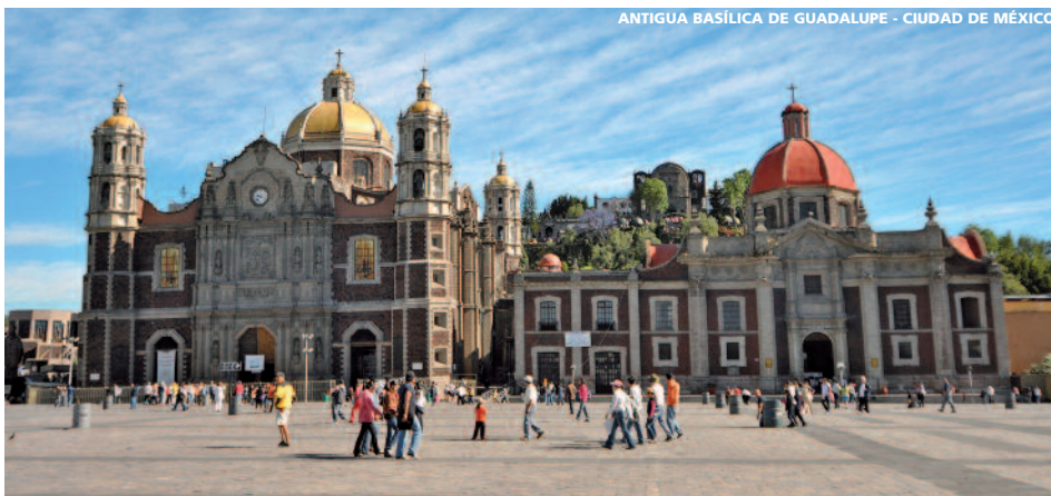
ANTIGUA BASÍLICA DE GUADALUPE - CIUDAD DE MÉXICO

Visita de la zona arqueológica de Palenque ubicada en la jungla Chiapaneca. De entre todos sus templos el más importante es el llamado Templo de las Inscripciones donde fue descubierta la tumba de Pakal con su famosa máscara de jade. Por la tarde continuación a Campeche . Llegada al hotel y alojamiento.