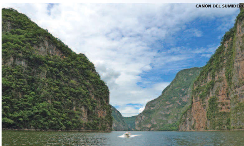
CAÑÓN DEL SUMIDERO

• Jueves • Desayuno A la hora convenida traslado al aeropuerto.