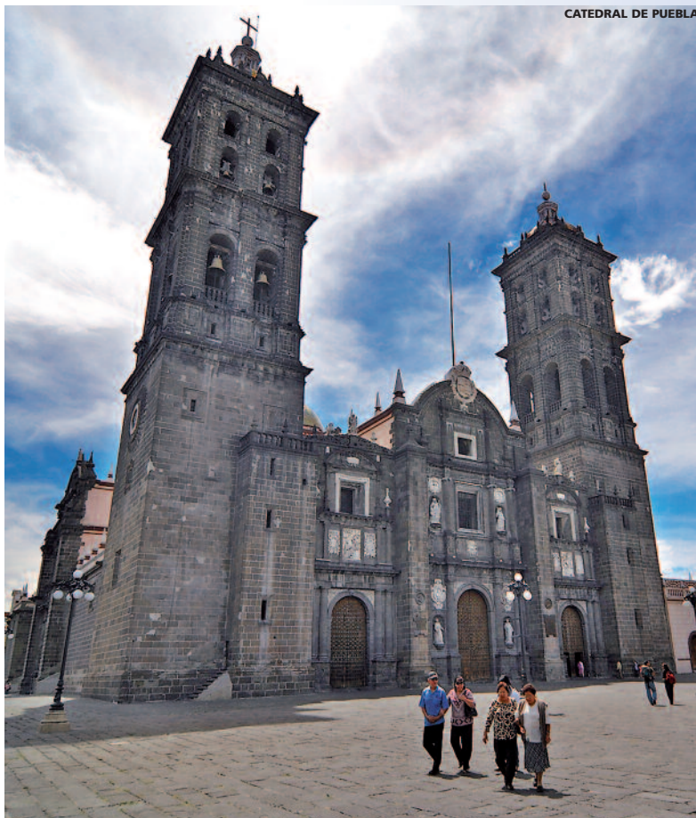
CATEDRAL DE PUEBLA

- (1) Niños menores de 12 años compartiendo habitación con 2 adultos.