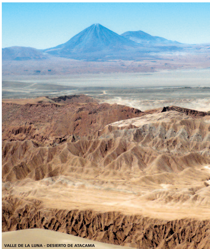
VALLE DE LA LUNA - DESIERTO DE ATACAMA

Nota: Consultar Suplementos en caso de realizar más de una de estas extensiones.