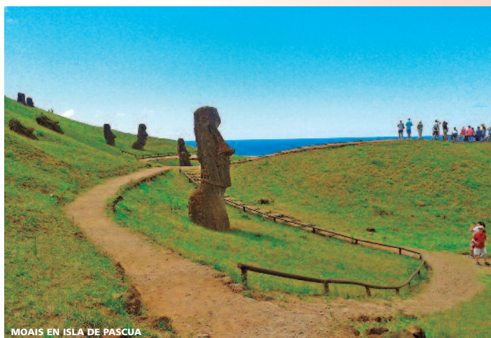
MOAIS EN ISLA DE PASCUA

Nota: Consultar Suplementos en caso de realizar más de una de estas extensiones.