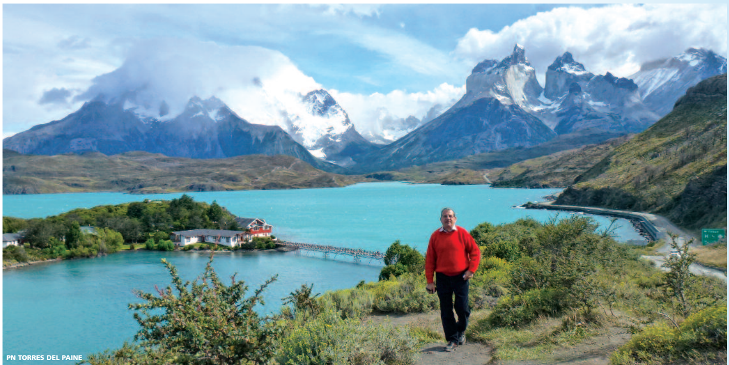
PN TORRES DEL PAINE

Perito Moreno, la laguna el Trébol, la península San Pedro, los cerros Otto, López, Catedral y la ciudad de Bariloche. Continuando el recorrido a la Península de Llao Llao, veremos el gran hotel y la capilla de San Eduardo. Boreamos la laguna el Trébol para luego regresar a Bariloche. Tarde libre. Alojamiento en el hotel.