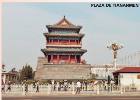
PLAZA DE TIANANMEN

Llevar la documentación en regla es obligación personal del viajero. Para tramitar el visado de China necesitamos pasaporte original electrónico (validez mínima 6 meses), 1 fotografía y el formulario de tramitación del visado (4 hojas) debidamente cumplimentado (imprescindible indicar profesión, lugar de trabajo, dirección domicilio particular, teléfono fijo y teléfono móvil). Las notas en este folleto sobre visados se refieren a ciudadanos españoles, por favor otras nacionalidades consulten con la embajada/consulado. La documentación requerida deberá obrar en nuestro poder con un mínimo de 21 días antes de la fecha de salida Coste del Visado: 140 € . Para la entrada en Tíbet es necesario obtener un permiso especial una vez tramitado el visado de China. Nuestra oficina en Pekín se ocupa de este trámite.