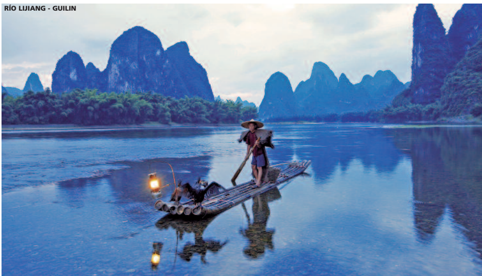
RÍO LIJIANG - GUILIN