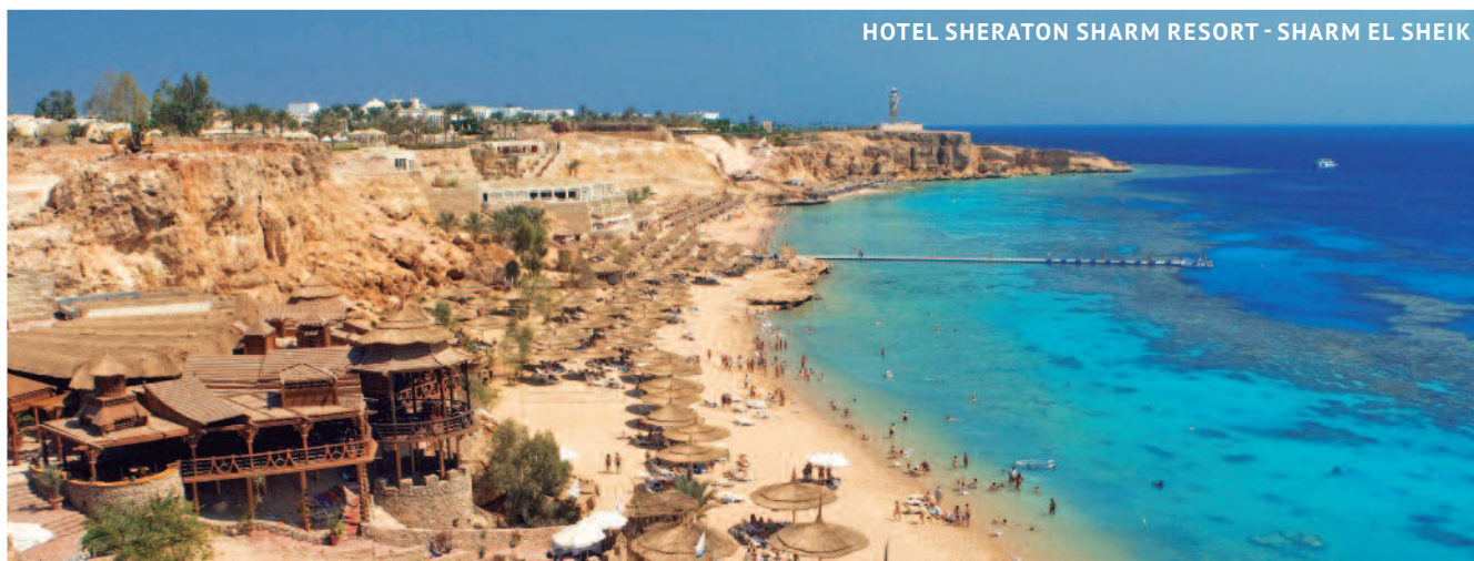
HOTEL SHERATON SHARM RESORT - SHARM EL SHEIK