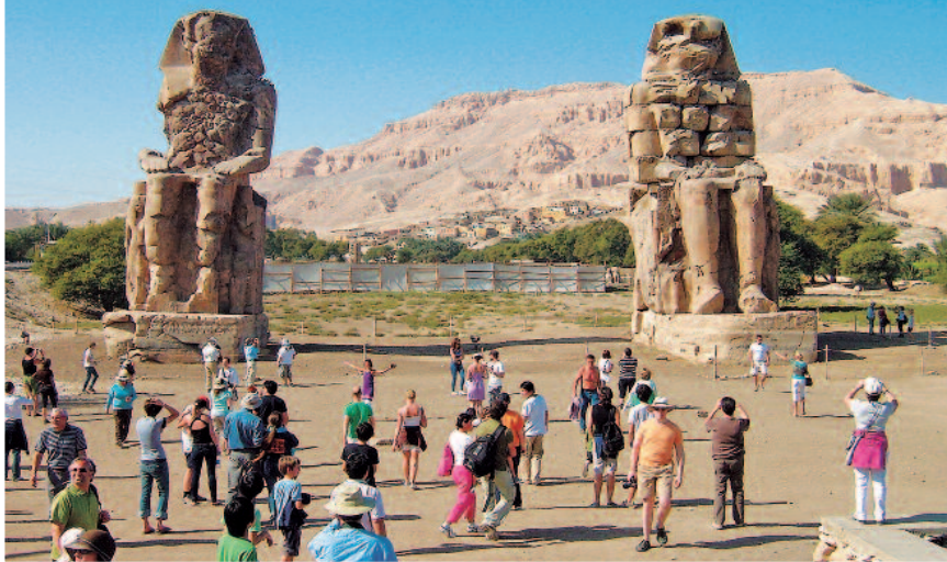
COLOSOS DE MEMNON