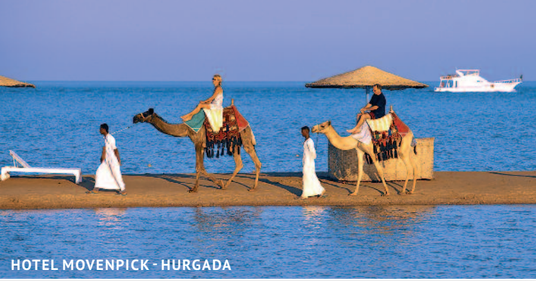
HOTEL MOVENPICK - HURGADA