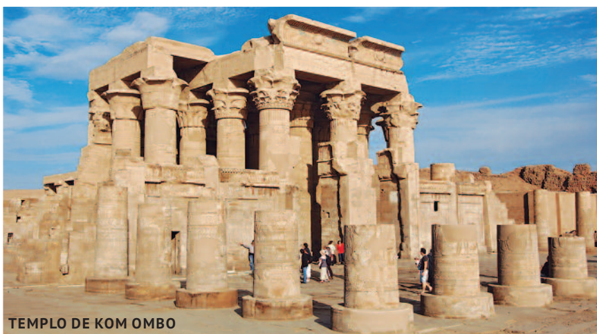
TEMPLO DE KOM OMBO