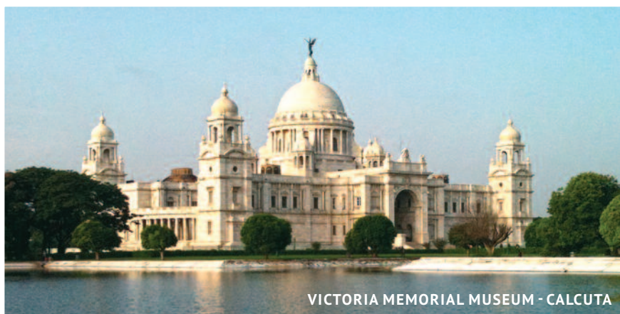
VICTORIA MEMORIAL MUSEUM - CALCUTA