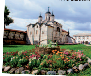
SAN CIRILO DEL LAGO BLANCO

- Visita Panorámica. En las confluencias de los ríos Kotorols y Volga está situada la ciudad más grande del Anillo de Oro, Yaroslavl. Fundada en el siglo X por el príncipe ruso Yaroslavl el Sabio. Gran centro turístico que conserva monumentos históricos y arquitectónicos como la Iglesia del Profeta Elías, La Iglesia de la Natividad de Cristo y San Miguel Arcángel. Su centro urbano ha sido declarado "Patrimonio de la Humanidad" por la UNESCO en 2005. Monasterio de la Transfiguración: Es la construcción más antigua de la ciudad, formada por la Iglesia de 5 cúpulas y la torre de aguja dorada. Iglesia del profeta Elías donde podemos apreciar sus frescos pintados por uno de los iconografos más destacados del siglo XVII, Nikita Gouriyev. Los artistas plasmaron en los frescos únicamente escenas de la vida cotidiana, por lo que su visita nos da una idea de cómo se desarrollaba la vida en Rusia en el siglo XVII.