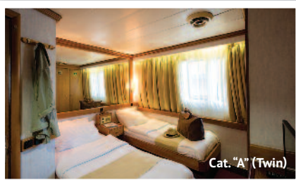
Cat. "A" (Twin)