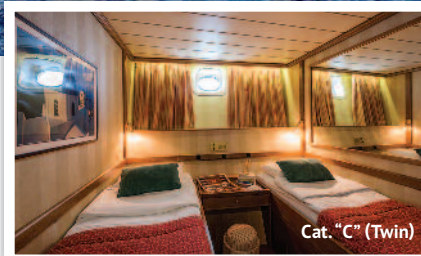
Cat. "C" (Twin)