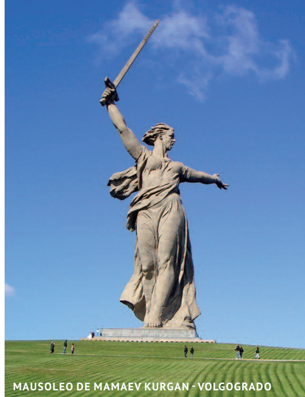
MAUSOLEO DE MAMAEV KURGAN - VOLGOGRADO