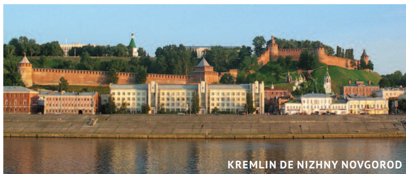
KREMLIN DE NIZHNY NOVGOROD

Politours dispone de otros Cruceros con programas e itinerarios similares navegando por el gran Volga, nótese que de las doce sedes donde se celebrará el Campeonato de Fútbol 2018, ocho de ellas están en su cuenca. Rogamos solicitar información detallada y precios.