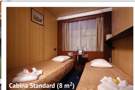
Cabina Standard (8 m 2 )