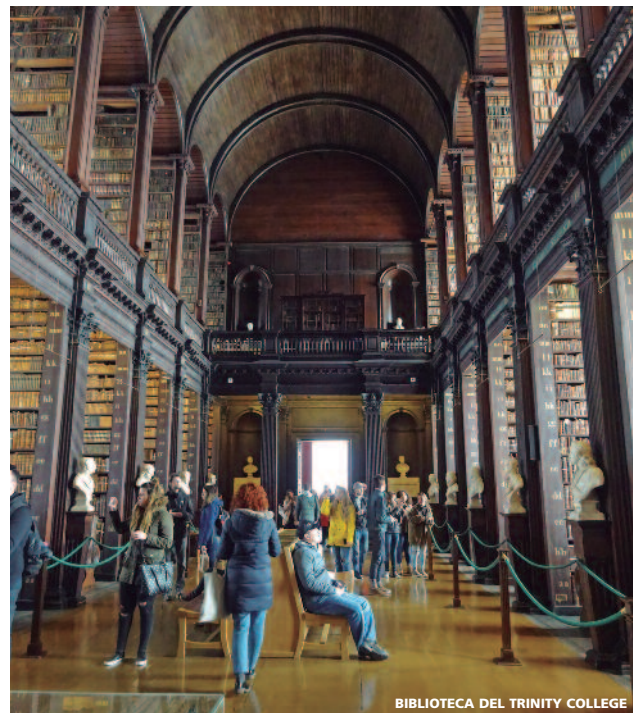
BIBLIOTECA DEL TRINITY COLLEGE

Irlanda . País del mágico pueblo Celta merece una visita. Por toda la isla se encuentran puertas que conducen a otras épocas, Cruces celtas que nos recuerdan el origen cultural de la isla, dólmene de la edad de piedra, monasterios y abadías milenarias, castillos medievales todos con leyendas escondidas y algunos hasta con fantasmas. Descubre en mágico condado de Kerry con quizá los paisajes más espectaculares de la isla, sin dejar de ver los impresionantes acantilados de Moher cayendo más de 700 pies sobre un embravecido Océano Atlántico. Descubra Irlanda en cualquier época del año.