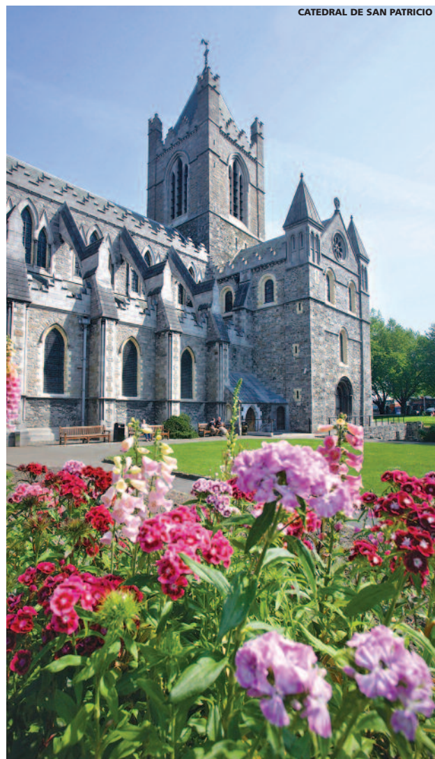
CATEDRAL DE SAN PATRICIO