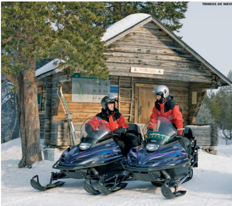
TRINEOS DE NIEVE