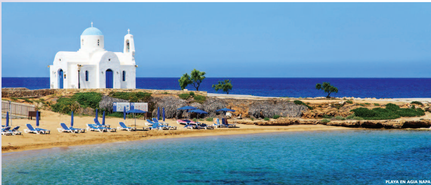
PLAYA EN AGIA NAPA