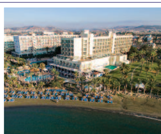
Hotel GOLDEN BAY 5* / LÁRNACA www.goldenbay.com.cy

Suplemento por habitación vista mar (por persona y noche) ..... 13