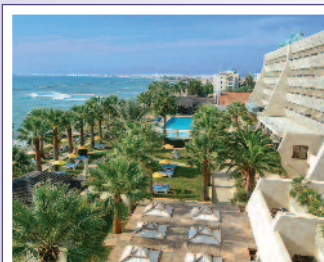
Hotel PALM BEACH 4* / LÁRNACA www.palmbeachhotel.com

Suplemento por habitación vista mar lateral (por persona y noche) ..... 15