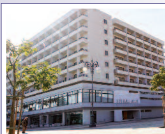
Hotel SUN HALL 4* / LÁRNACA www.sunhallhotel.com.cy

- Nota: Las reservas aéreas están sujetas y/o condicionadas por las normas de cada Compañía aérea, siendo algunas de las clases utilizadas de emisión inmediata (48/72 horas después de realizar la reserva). Les recordamos que los billetes aéreos una vez emitidos no son reembolsables.