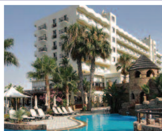
Hotel LORDOS BEACH 4* / LÁRNACA www.lordosbeach.com.cy

Suplemento por habitación vista mar (por persona y noche) ..... 15