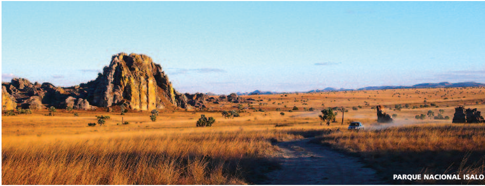
PARQUE NACIONAL ISALO

17/19/20 días (14/16/17n hotel + 2n avión) desde 2.305 €