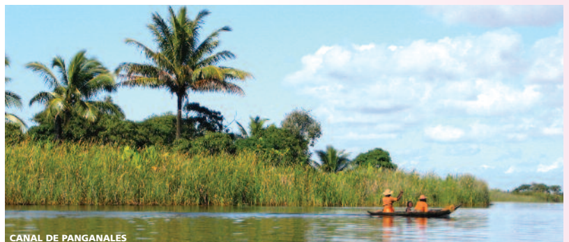
CANAL DE PANGANALES