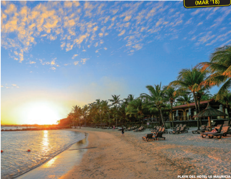
PLAYA DEL HOTEL LE MAURICIA