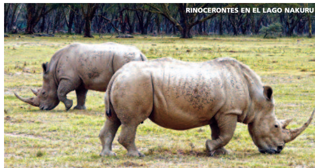
RINOCERONTES EN EL LAGO NAKURU

• Domingo. Llegada a París y conexión con vuelo destino España. Llegada.