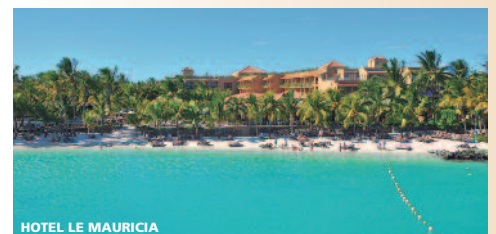
HOTEL LE MAURICIA