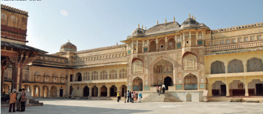
FUERTE AMBER - JAIPUR

• Miércoles • Desayuno. Visita de la parte occidental de los Templos de Khajuraho , una explosión escultórica, más sensual que erótica. Visitaremos los Templos de Lakshmana, Kandariya Mahadeva y Devi Jagadambi . Continuación de la