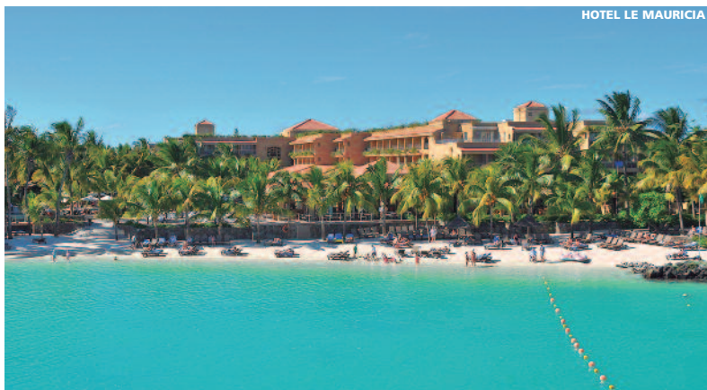
HOTEL LE MAURICIA