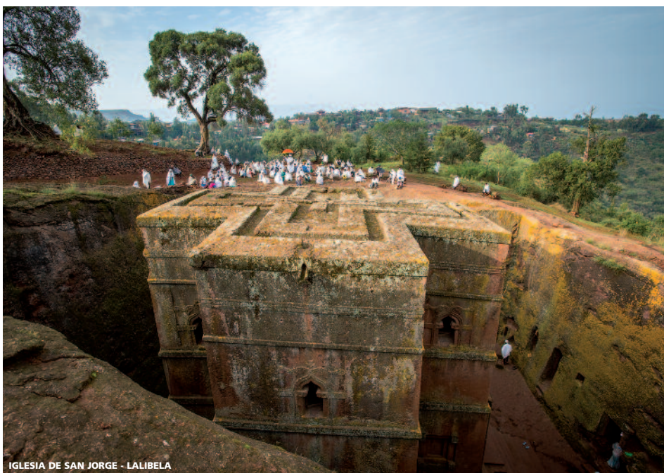
IGLESIA DE SAN JORGE - LALIBELA