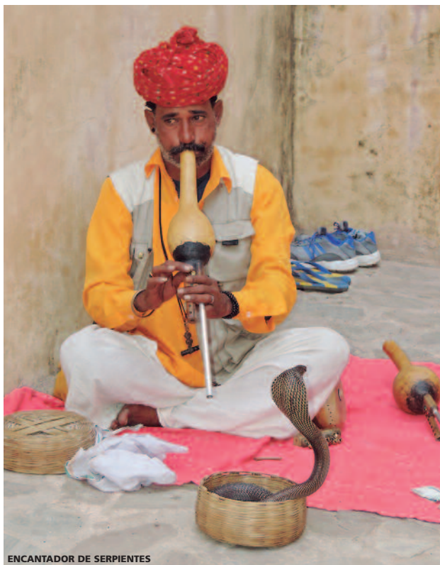
ENCANTADOR DE SERPIENTES

• Sábado • Desayuno. Traslado por carretera a Delhi . A la hora indicada traslado al aeropuerto con destino Madras . Llegada a Madras, capital de Tamil, Nadú y una de las cuatro grandes metrópolis de la India. Traslado al hotel. Alojamiento.