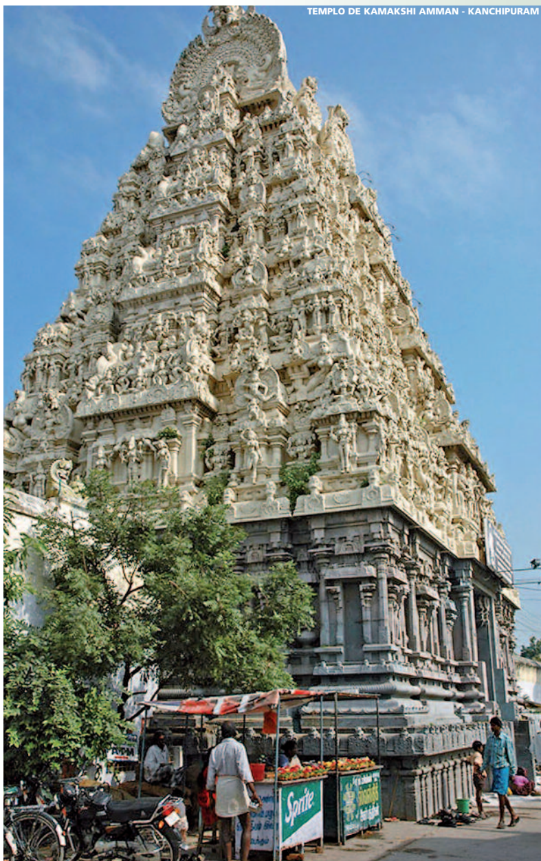
TEMPLO DE KAMAKSHI AMMAN - KANCHIPURAM