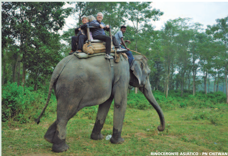
RINOCERONTE ASIÁTICO - PN CHITWAN

Precios por persona desde Madrid, Barcelona, Bilbao y Málaga con la cia. Turkish Airlines, clase "V" (en euros; mínimo 2 personas)