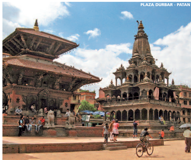
PLAZA DURBAR - PATAN