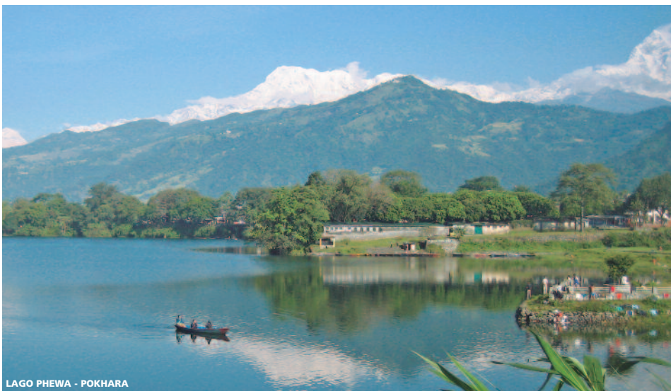
LAGO PHEWA - POKHARA

HOTELES Turista Sup. a Lujo Incluyendo 7 DESAYUNOS, PC en PARQUE CHITWAN, SAFARI en ELEFANTE y 8 VISITAS