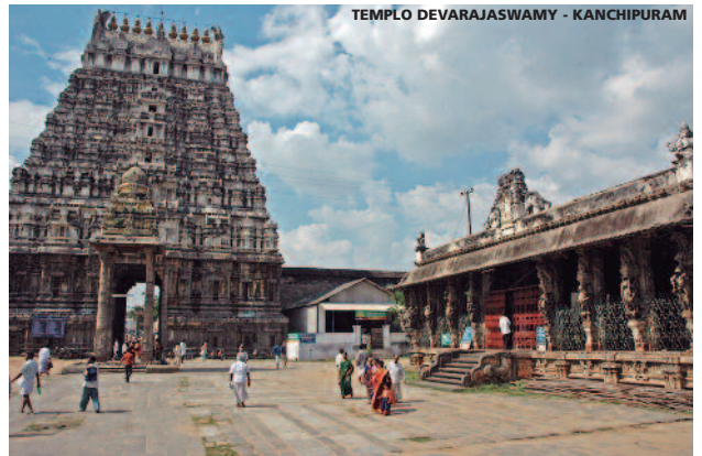
TEMPLO DEVARAJASWAMY - KANCHIPURAM

Saldremos por carretera hacia Madurai visitando en ruta Trichy . Subiremos al Fuerte de la Roca , con el Pasaje de las Cien Columnas, coronado por el templo dedicado al Dios Vinayaka. En la isla Srirangam , sobre el río Kaveri, visitaremos el gran templo Ranganathswami rodeado de siete murallas concéntricas, con 21 puertas de acceso y santuarios y salas, algunas de ellas de hasta mil columnas. Salida por carretera a Madurai , antigua ciudad de los Pandyas y centro de peregrinación. Alojamiento en el hotel.