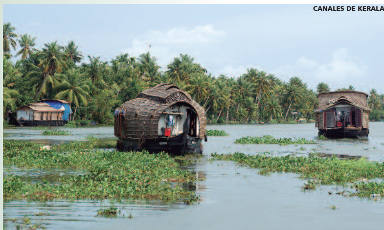
CANALES DE KERALA

Existe la posibilidad de realizar su viaje en los emblemáticos hoteles de las cadenas Taj y Oberoi Hotels. Rogamos consulte suplemento para las distintas temporadas.