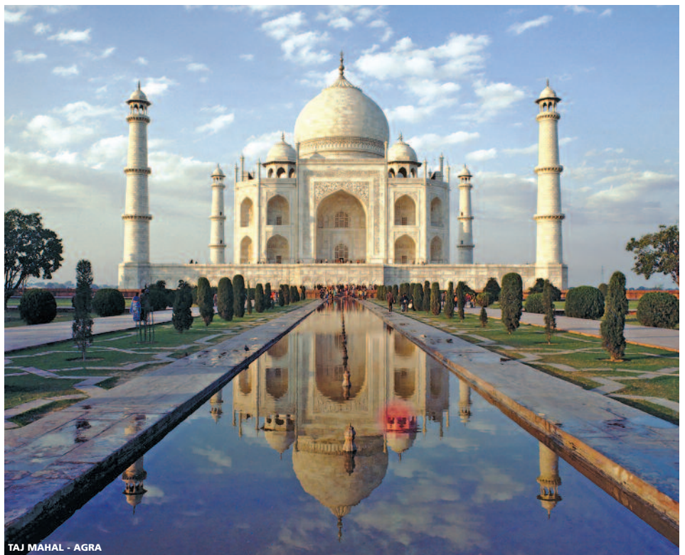
TAJ MAHAL - AGRA