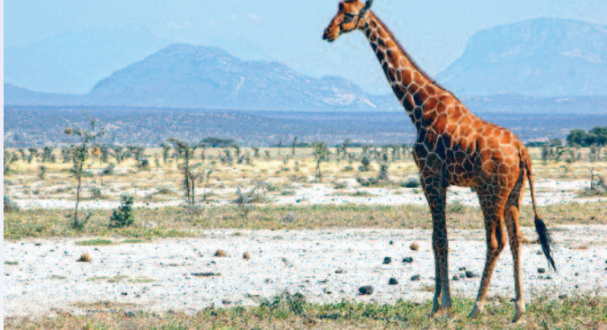
JIRAFAS RETICULADAS - PN SAMBURU

(Ver día 2º programa base Tierra Masai, página anterior).