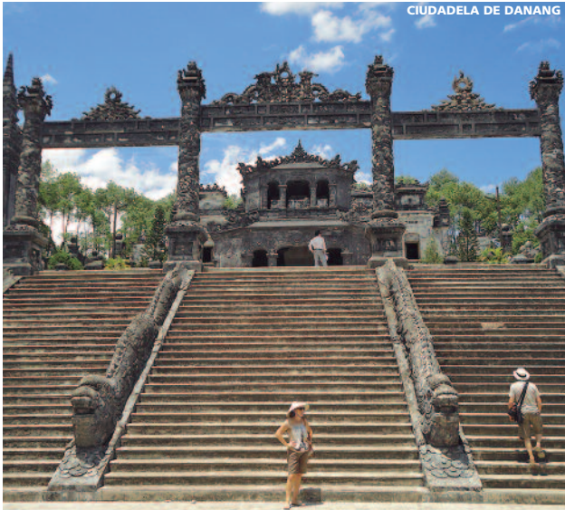
CIUDADELA DE DANANG

Precios por persona desde Madrid, Barcelona, Bilbao, Málaga y Valencia con las cías. Vietnam Airlines, clase "T" y Turkish Airlines, clase "V" (base hab. doble, en euros, mínimo 2 personas)