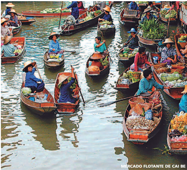
MERCADO FLOTANTE DE CAI BE