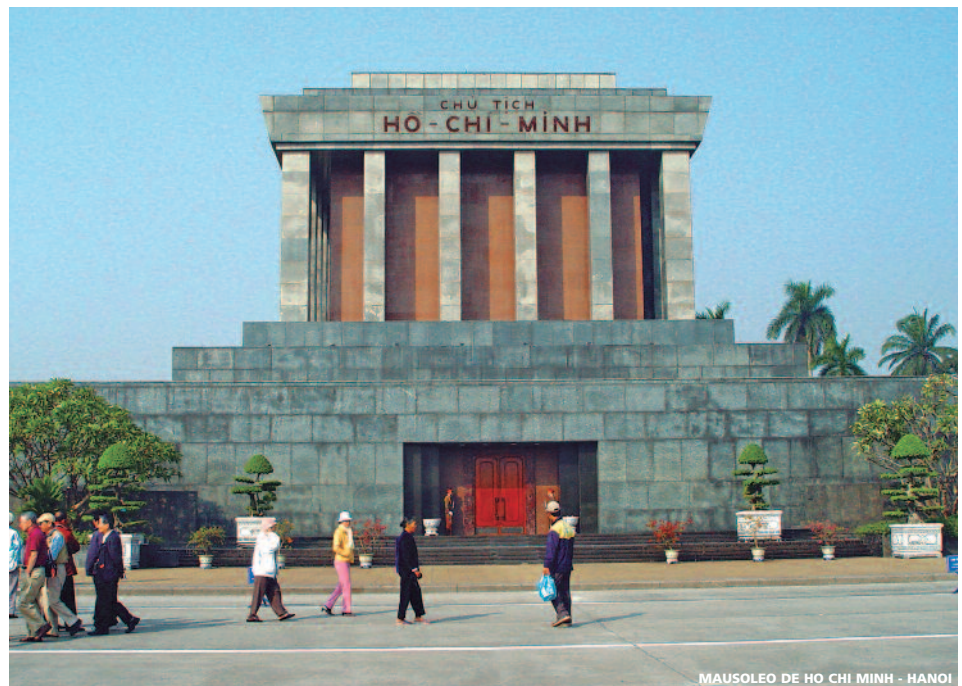
MAUSOLEO DE HO CHI MINH - HANOI