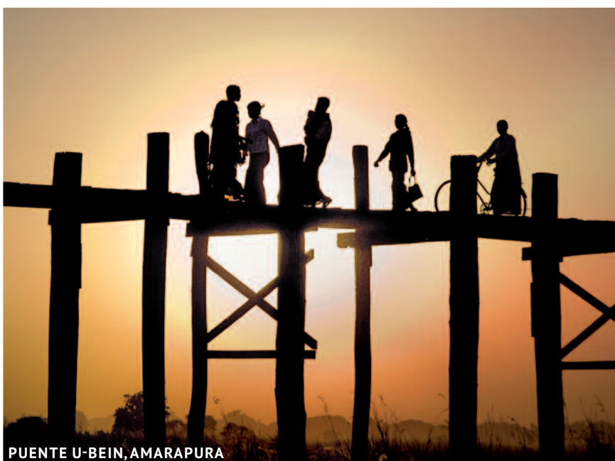
PUENTE U-BEIN, AMARAPURA