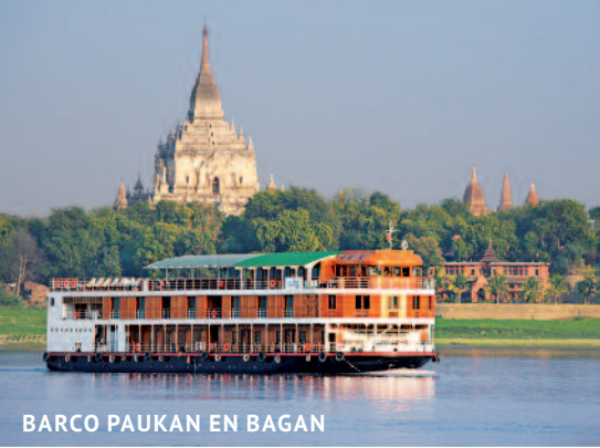
BARCO PAUKAN EN BAGAN