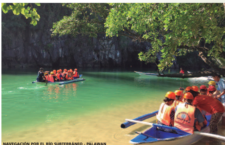
NAVEGACIÓN POR EL RÍO SUBTERRÁNEO - PALAWAN