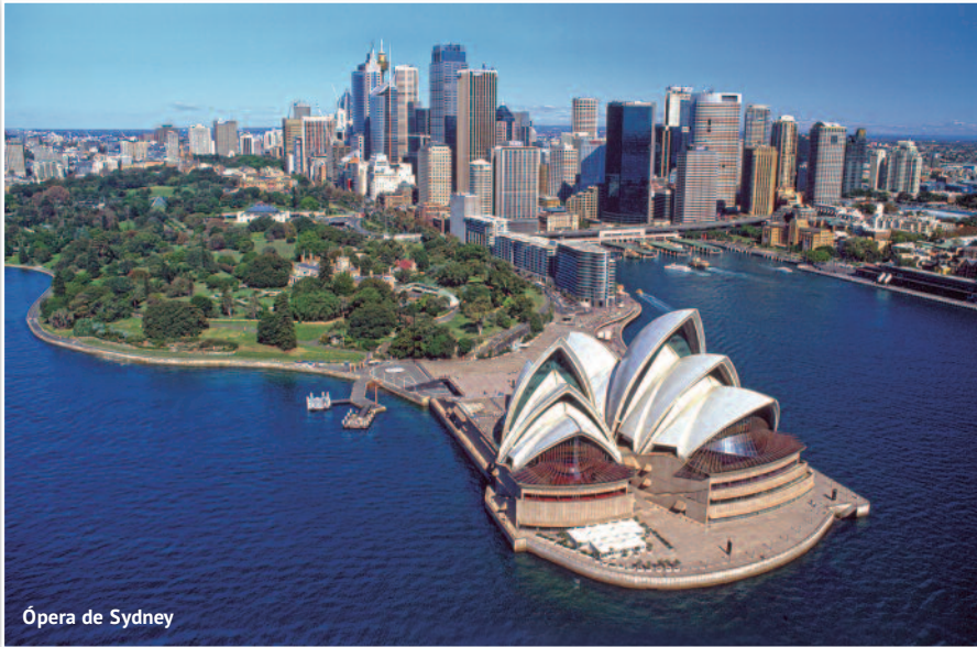
Ópera de Sydney