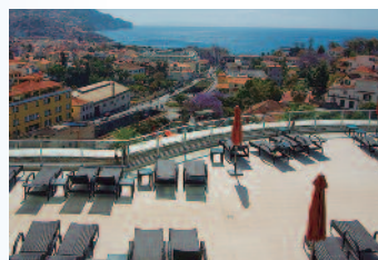
H. FOUR VIEWS BAIA 3*5 Rua das Maravilhas, 74 – Tel. 291 700 200