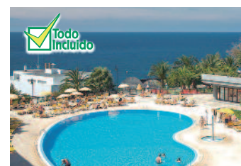
H. ENOTEL LIDO 5* (Rég. T.I.) Rua Simplicio dos Passos Gouveia, 29 – Tel. 291 724 239