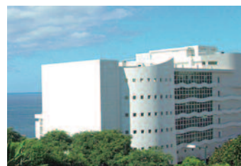
H. MELIA MADEIRA MARE RESORT & SPA 5* Rua de Leichlingen, 2 – Tel. 291 724 140