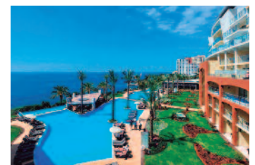
H. PESTANA PROMENADE 4* Rua Simplicio dos Passos Gouveia, 31 – Tel. 291 141 400