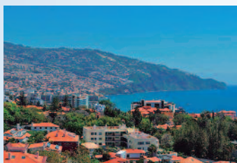
H. DORISOL BUGANVILLA 3* Rua Da Casa Branca, 98 – Tel. 291 706 615