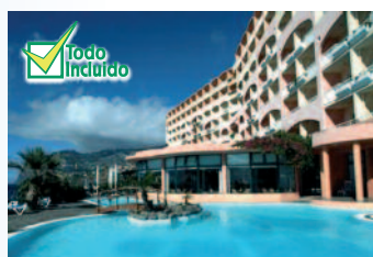
H. PESTANA BAY OCEAN 4* (Rég. T.I.) Praia Formosa – Tel. 291 701 900