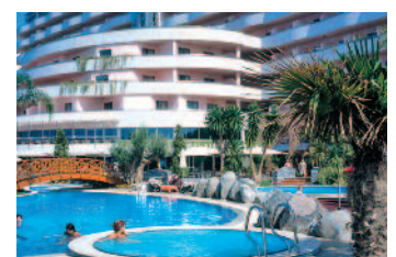
H. ROYAL SAVOY 5* R. Carvalho Araújo, 9000-022 – Tel. 291 213 500