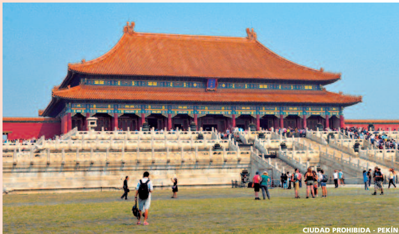
CIUDAD PROHIBIDA - PEKIN