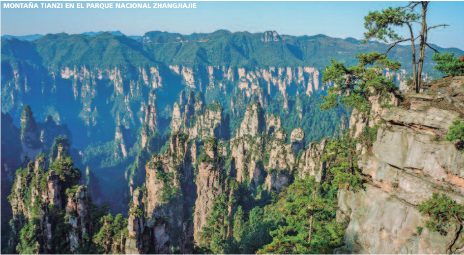
MONTAÑA TIANZI EN EL PARQUE NACIONAL ZHANGJIAJIE

12 días (10n. hotel + 1n. avión) desde 2.240 €