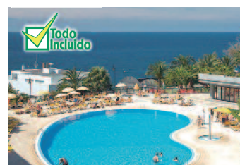
H. ENOTEL LIDO RESORT & SPA 5* (Rég. T.I.) Rua Simplicio dos Passos Gouveia, 29 – Tel. 291 724 239