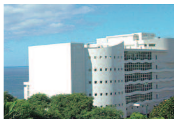
H. MELIA MADEIRA MARE RESORT & SPA 5* Rua de Leichlingen, 2 – Tel. 291 724 140