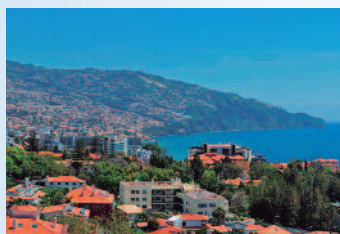
H. DORISOL BUGANVILLA 3* Rua Da Casa Branca, 98 – Tel. 291 706 615