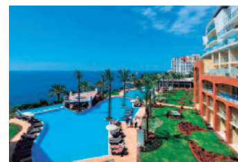
H. PESTANA PROMENADE 4* Rua Simplicio dos Passos Gouveia, 31 – Tel. 291 141 400