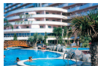
H. ROYAL SAVOY 5* R. Carvalho Araújo, 9000-022 – Tel. 291 213 500