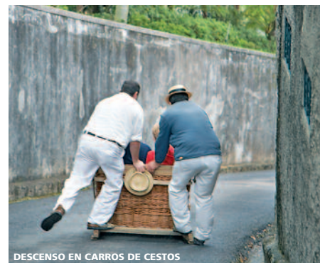
DESCENSO EN CARROS DE CESTOS