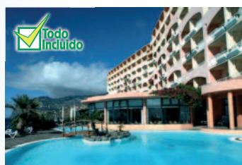
H. PESTANA BAY OCEAN 4* (Rég. T.I.) Praia Formosa – Tel. 291 701 900