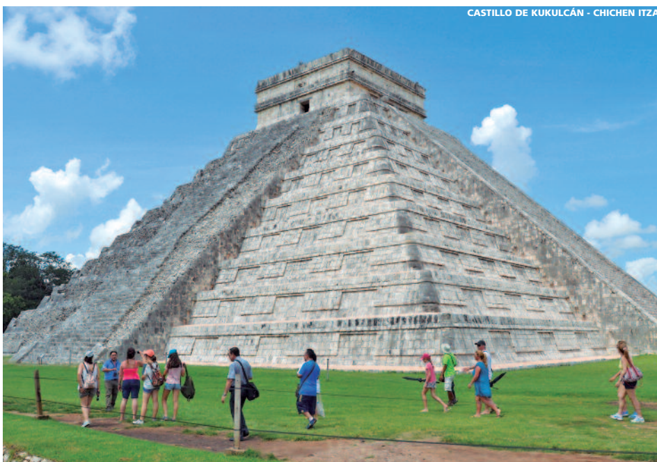
CASTILLO DE KUKULCÁN - CHICHEN ITZA

Día 1º España/Ciudad de México Presentación en el aeropuerto, para salir en vuelo de línea regular con destino a Ciudad de México . Llegada, traslado y alojamiento. (Los Sres. clientes de otras ciudades llegan a Madrid en vuelos nacionales.)