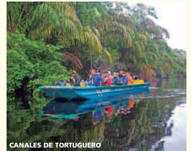
CANALES DE TORTUGUERO

Llegada (Los Sres. Viajes de Barcelona y otras ciudades continúan en vuelo nacional a su lugar de origen).