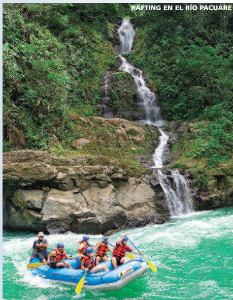
RAFTING EN EL RÍO PACUARE

Incluyendo 8 DESAYUNOS, 2 ALMUERZOS, 1 CENA y 7 VISITAS