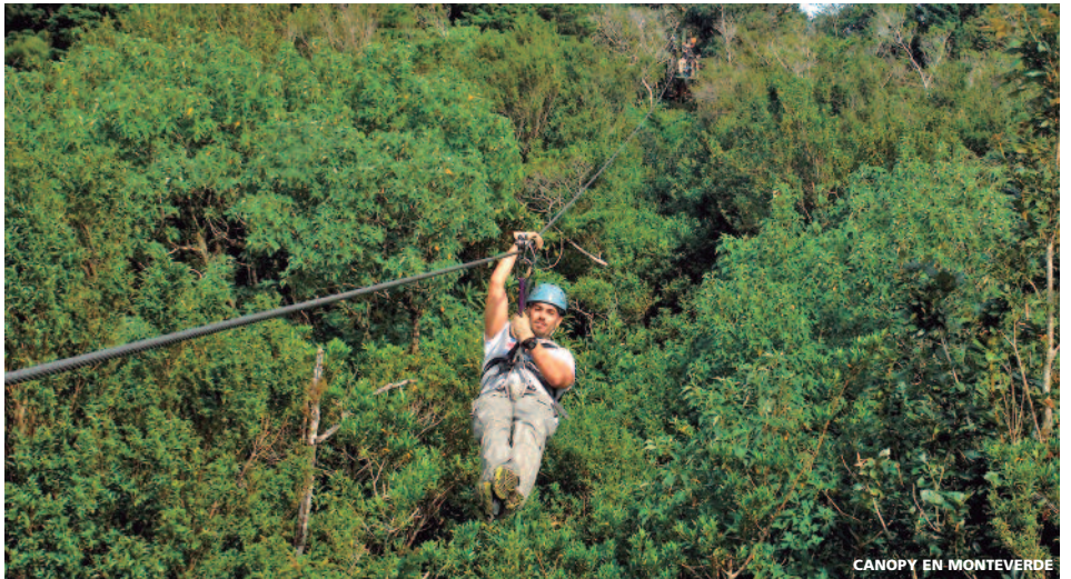
CANOPY EN MONTEVERDE

Montañas. Después de esta increíble aventura continuación a las llanuras del norte del país donde el impresionante Volcán Arenal dará la bienvenida. Llegada por la tarde al hotel y resto del día libre. Alojamiento.