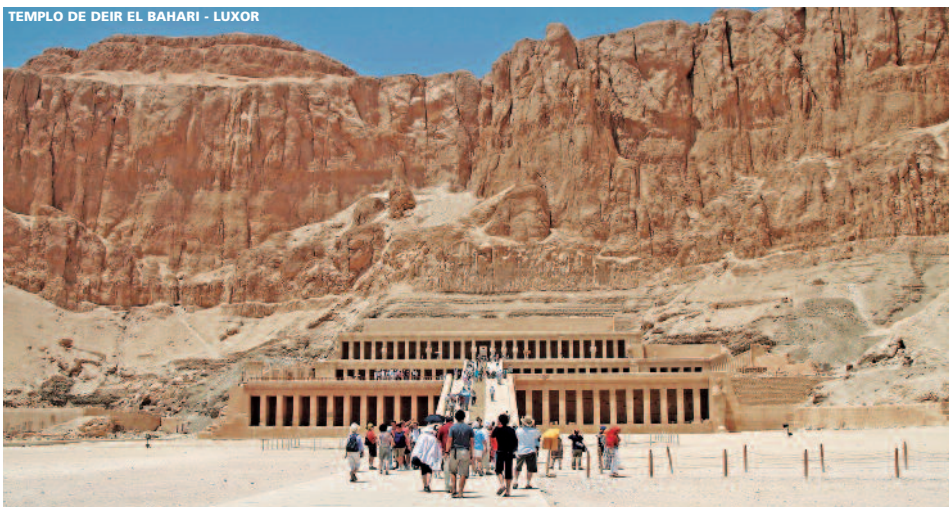
TEMPLO DE DEIR EL BAHARI - LUXOR

8 días (4n barco + 3n hotel) desde 1.075 €