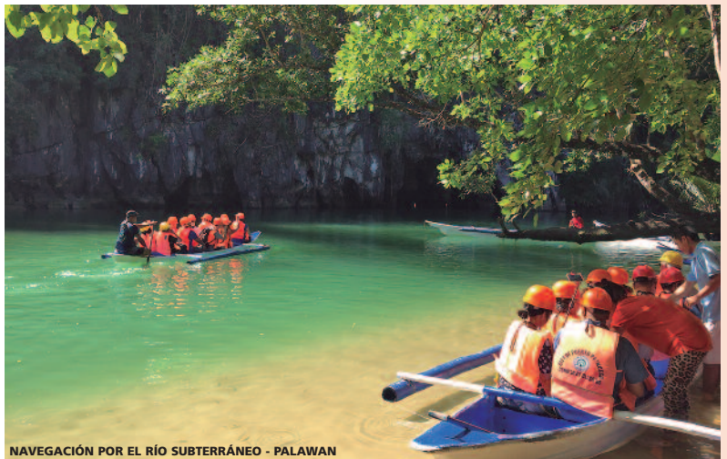
NAVEGACIÓN POR EL RÍO SUBTERRÁNEO - PALAWAN