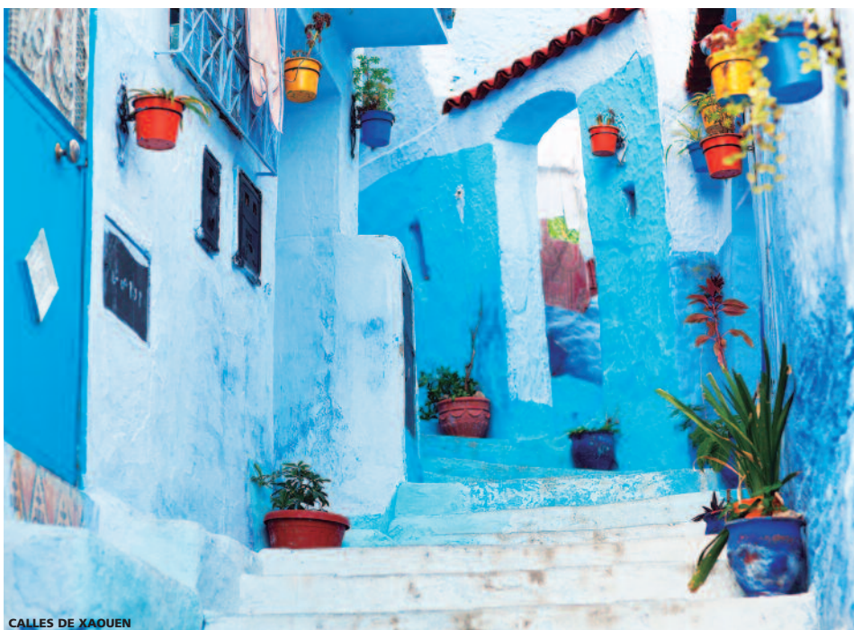
CALLES DE XAOUEN

- EMISIÓN SUPERINMEDIATA: Se garantizan los precios publicados de reservas de emisión inmediata 14 días antes de la fecha de salida.