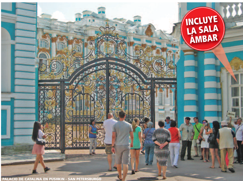
PALACIO DE CATALINA EN PUSHKIN - SAN PETERSBURGO