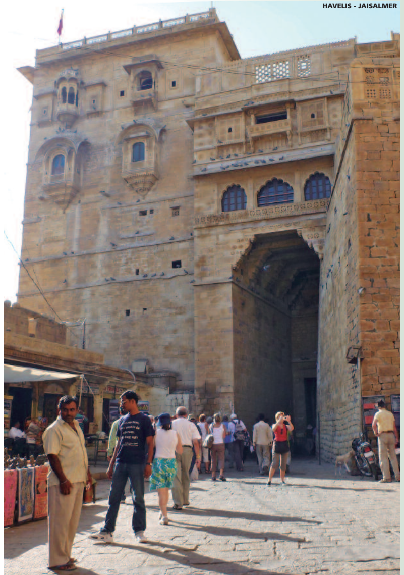
HAVELIS - JAISALMER

Llegada a las distintas ciudades de origen en España.