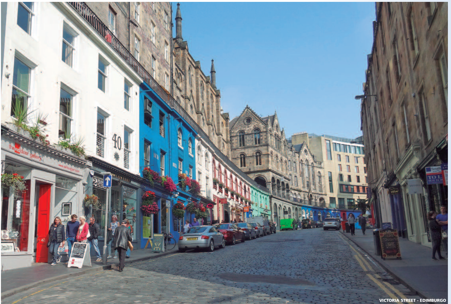
VICTORIA STREET - EDIMBURGO

del almuerzo (no incluido) y tiempo libre. Continuamos hacia el espectacular valle de Glencoe, hasta llegar a Luss , un precioso pueblo considerado área de conservación histórica, situado a orillas del Lago Lomond. Llegada a Glasgow . Alojamiento.