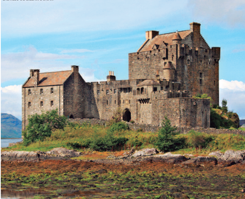
CASTILLO DE EILEAN DONAN