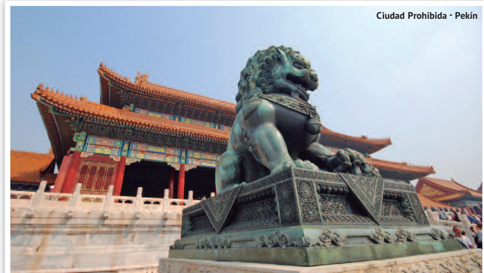
Ciudad Prohibida - Pekín

Paquete aéreo aproximado, pendiente de confirmar al hacer la reserva